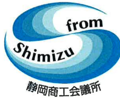
静岡商工会議所/清水支所 「from Shimizu」