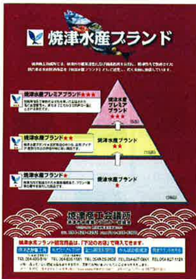
焼津商工会議所 「焼津水産ブランド」