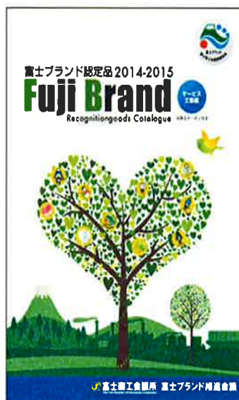
富士商工会議所 「Fuji Brand」