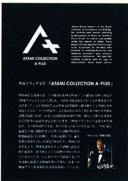
熱海商工会議所 「ATAMI COLLECTION A-PLUS」