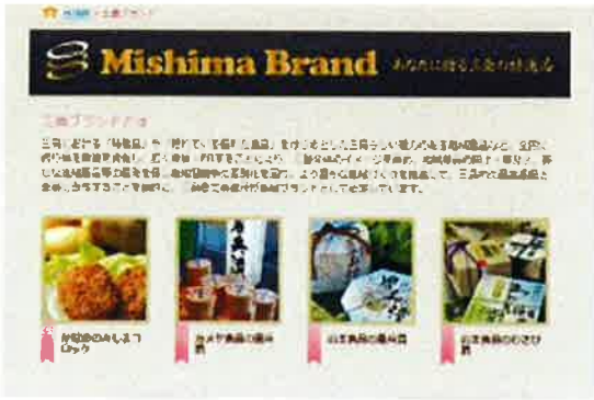
三島商工会議所 「Mishima Brand」