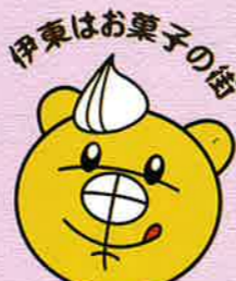
伊東お菓子共和国公式マスコット クリームぼんた