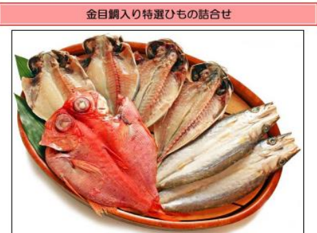
新鮮な魚を厳選し、平田屋独自の塩かげんで仕上げた干物の逸品を詰合せました。