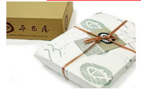
日常使いにもハレの日にも、世代を問わずお召し上がりいただける上質なひものは、ギフトとしても最適です。